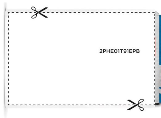
Иллюстрация № 2