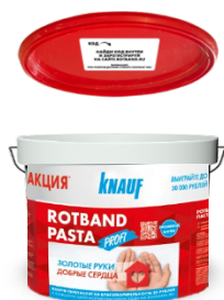
Иллюстрация № 3